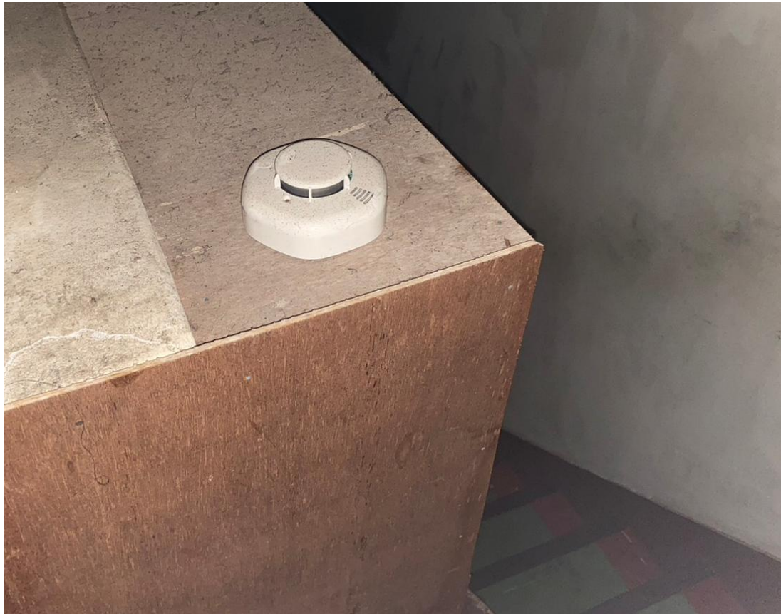
圖三：動作之住警器