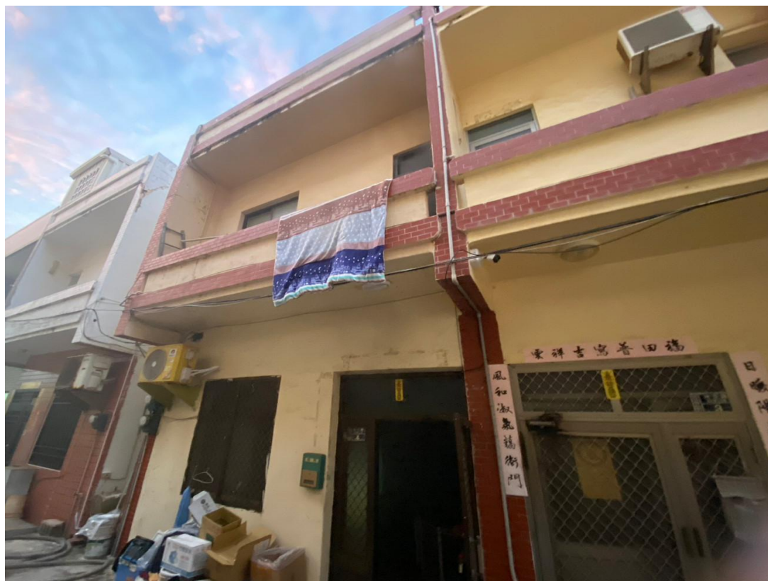
圖一：起火建築物外觀